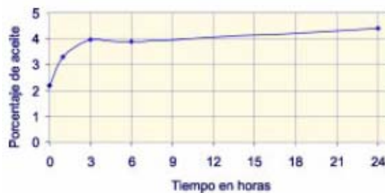
Figura 1. Determinación del tiempo mínimo de contacto del solvente con fibra seca en el proceso de lixiviación.

Tiempo mínimo de contacto: como se observa en la Figura 1, después de tres horas de contacto, la cantidad de aceite extraído permanece constante, debido a que se ha alcanzado el equilibrio ternario.